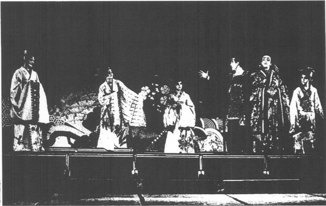
"El Mikado", exponente de un nuevo tipo de teatro comercial.