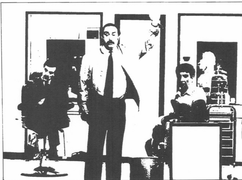
"Pels Pèls", de Paul Portner, en el Teatro Victoria.

Ordenar los 117 espectáculos según el número de espectadores que los han contemplado, permite establecer la denominada Curva de Lorenz, donde quedan relacionados el porcentaje de espectadores y el porcentaje de espectáculos (3). A pesar de su aridez geométrica, esta curva da lugar a unas evidencias claras: tres espectáculos (un 2,5 % del total), han concentrado el 40 % de todos los espectadores de Barcelona, y el 50 % de los montajes presentados durante la temporada sólo han conseguido captar, en conjunto, un 5 % del público. Su incidencia sobre la población, en términos cuantitativos, es completamente insignificante porque sólo han congregado, en total, 45.000 espectadores, esto es, 775 personas de media cada uno de ellos.