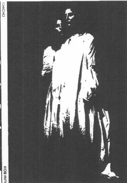
Escenas de "Slastic", de Tricicle, y "El despertar de la primavera", de Wedekind, por la compañía de Flotats.

Área Metropolitana), con la esperanza de encontrar un número igual (o superior) de compradores. Se han vendido 887.331 (es decir, no llega a una tercera parte del aforo ofrecido) por un importe global de 823,5 millones de pesetas, y a un precio medio de 928 pesetas la localidad. La asistencia media ha sido de 258 espectadores por función (tabla 4).