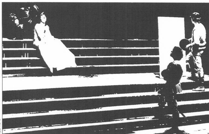
Con "Lorenzaccio, Lorenzaccio", el Lliure logra vender diariamente el 88 por 100 de su aforo.