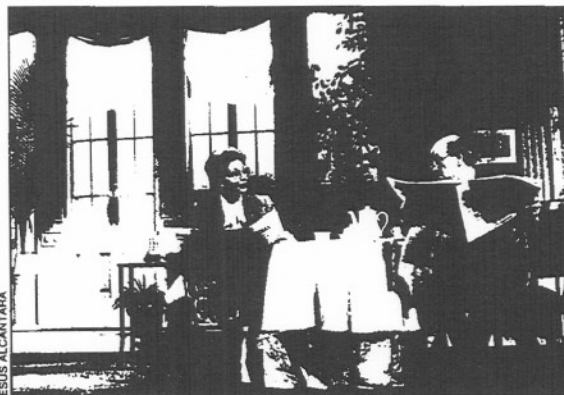
"El manifiesto", en el Goya: el mayor número de espectadores por función.

de estas cifras puede ser atenuado por la aparición de un fenómeno que no debe ser pasado por alto y que queda reflejado en el cuadro anexo. Mientras que durante los cuatro últimos meses de 1986 el número de espectadores por función cayó de forma regular, pasando de 342 en septiembre a 271 en diciembre (-21 %), durante el mismo período de 1987 esta media ha aumentado de modo igualmente continuo, saltando de 169 en septiembre a 325 en diciembre (+92 %). En otras palabras, si observamos la suma, el resultado es negativo; si analizamos los sumandos, positivo. O, en otras palabras todavía: va menos gente a los teatros, pero los teatros están más llenos. Son las pequeñas ventajas, en términos de rentabilidad, del cierre de locales. ■