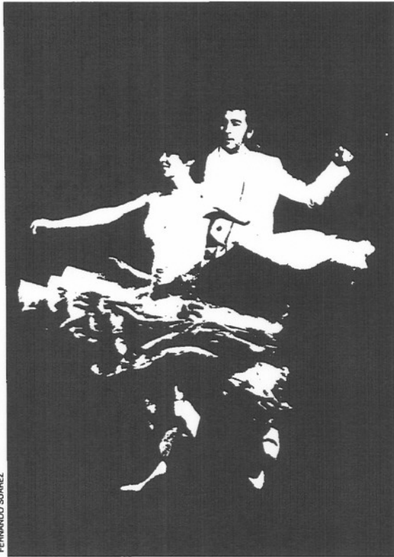
Concha Velasco en "Mamá, quiero ser artista".

El resumen cifrado se comenta por sí mismo: con respecto a febrero 1987, la recaudación cae en un 36 por ciento, el número de espectadores en un 39 por ciento, la oferta en un 23,5 por ciento y la asistencia media en casi un 10 por ciento. Dos de cada tres butacas son espacio vacío, inútilmente tapizado con el terciopelo rojo de una pasión no correspondida. Adiós, Regina, adiós: tu tumba estaba abierta. ■