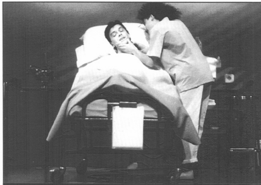
Escena de "El dret d'escollir".

A sí es como baja la curva de la temporada, tras un febrero dominado por las altas presiones atmosféricas e, inversamente, por una profunda depresión en los teatros barceloneses. Ha cerrado sus puertas el Regina, después de casi diez años de buscar su lugar bajo el sol de los focos, y sin que las administraciones no afectadas hayan visto alterado su pulso rutinario. Tal vez tengan razón, tal vez no importe demasiado: otros voluntaristas inician nuevas aventuras. Por ejemplo, los del Teatreneu, que abren en el barrio de Gracia la sala dels Teixidors por su cuenta y riesgo. No hay grandes nombres en la empresa —parecen decir las administraciones— y habrá que mantener una espera prudente antes de conectar esa iniciativa al suero de los fondos públicos. A eso se le llama eutanasia teatral.