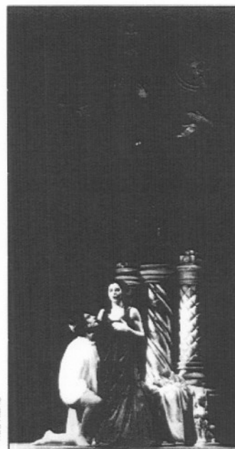
"El manuscrit d'Ali Bei" (izquierda), en el Lliure, y el "Tirant lo Blanc" (derecha), en el C. D. de la Generalitat.