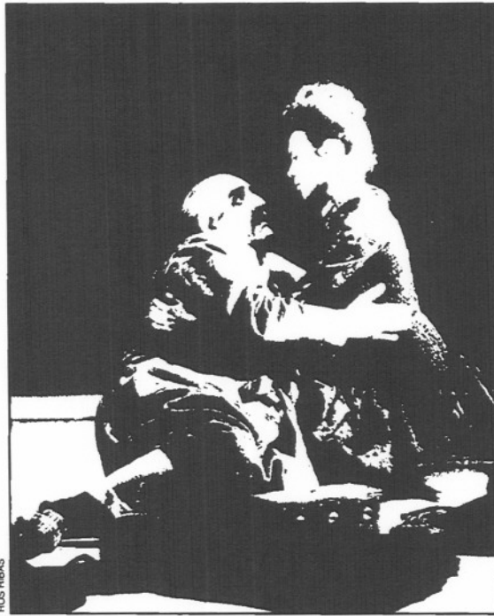
"La gran il·lusió", en el Romea, un caso para recapacitar.

burbial— se hunden en la media de 26 espectadores por función (procedentes en su mayor parte del Ensanche) en un teatro de 800 butacas situado en el centro de la ciudad y con escasas comunicaciones nocturnas con la periferia. "Este espectáculo merecerá una respuesta masiva", vaticinó la crítica en el momento del estreno. Tal vez sí, pero no en cualquier lugar, a cualquier hora. ■