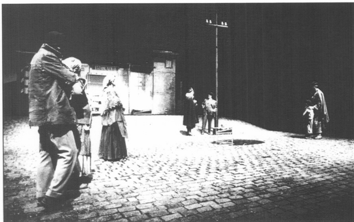
"La bona persona del Sezuán", único éxito del mes con el sello del Lliure y la firma de Puigserver.