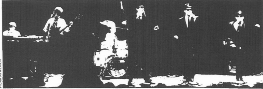
Pigeon Drop en una de sus actuaciones.