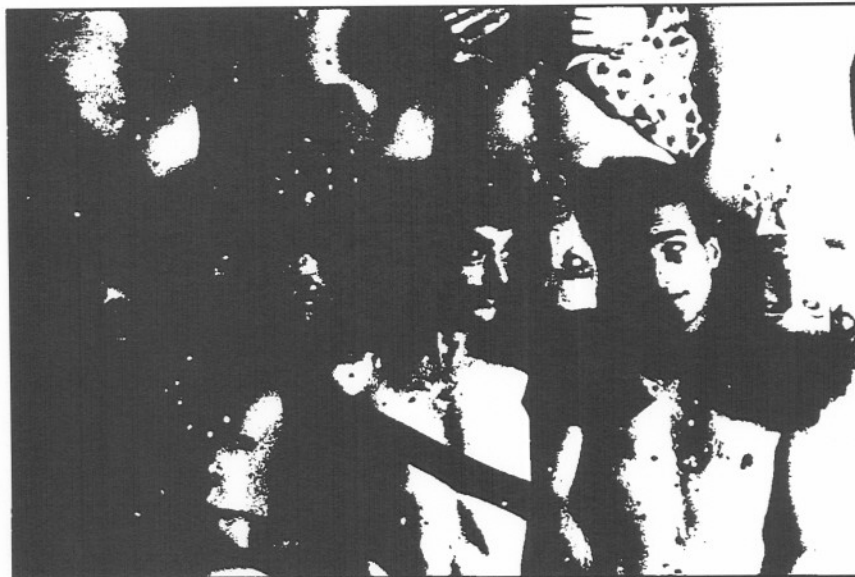
Pigeon Drop y su "Capaqui-capalla": buena taquilla en el Villarroel Teatre.

Todo queda muy claro en Barcelona: donde casi ya no existe la empresa privada, todo depende de ella, en realidad, siempre y cuando acierte. Hay pequeñas, casi insignificantes excepciones en este paisaje de la marginalidad, como los 3.805 espectadores de La marquesa Rosalinda en el Romea, dentro de un fantasmal Memorial Regàs, pero quedan rápidamente compensados por los 58 espectadores, en cinco funciones, de La estación de las dalias , un espectáculo avalado nada más y nada menos que por Mercè Rodoreda. Cada oveja vive en su festival y los señores Bru de Sala (Generalitat), Royes (Diputación) y Mascarell (Ayuntamiento) jamás han reservado mesa juntos para tratar del tema. Esta será una buena temporada, sin embargo. ■