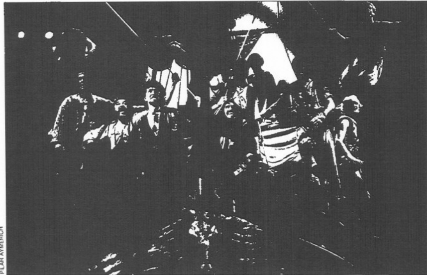
"Mar i cell", espectáculo de Dagoll Dagom.

La de estos profesionales no parece, desde luego, una buena estrategia frente a la Administración. Cuando escribo estas líneas, el Lliure está a punto de comprobar en carne propia que la imaginación y el progresismo se pagan caro. Tal vez Fabia Puigserver se equivocó y, en vez de vender el Lorenzaccio de Pasqual a 760 pesetas la butaca, llenando el 90 por 100 del aforo, debiera haberlo vendido a 1.137, aun a costa de dejar vacío el 60 por 100 del teatro. ■