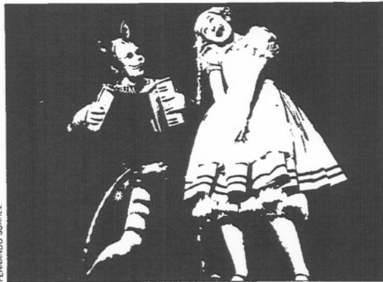
A la izquierda, "Suz/o/Suz", de La Fura dels Baus; a la derecha, "Alicia en el país de las maravillas", de Lindsay Kemp.