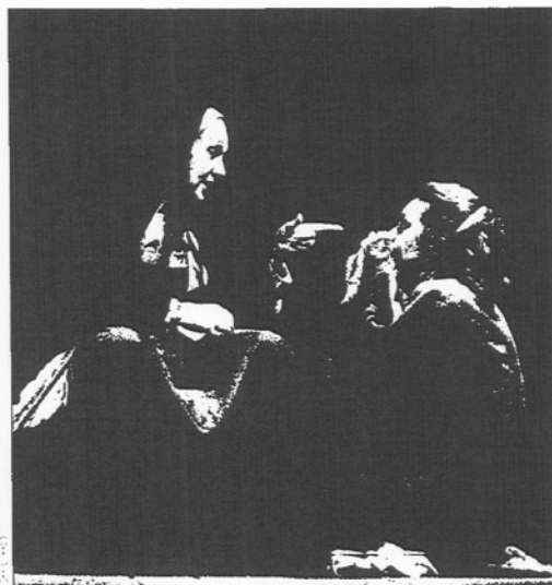
Excelente acogida en el Mercat de les Flors a la Compañía Nacional de Teatro Clásico: "El alcalde de Zalamea" (izquierda) y "La Celestina"