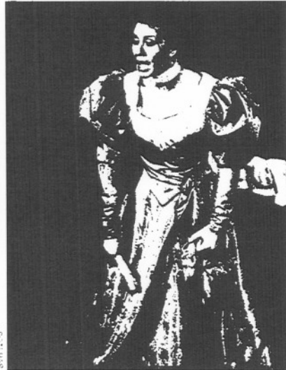
"Dancing", en el Condal (a la izquierda) y "Duros a quatre pessetes", en el Romea. Ambos ganaron espectadores.