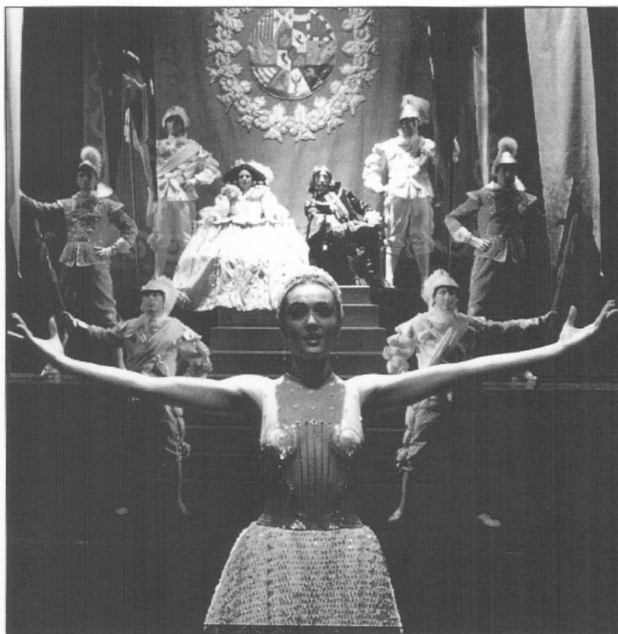
Loa de "El laurel de Apolo", incluida en la "Antología de la zarzuela".

D uran muy poco, últimamente, los récords en Barcelona. El de recaudación ha caído de nuevo en diciembre, por tercera vez consecutiva, como si la década quisiese cerrarse en coma muy alta (186,7 millones, doce más que en noviembre), y poner a prueba la capacidad de los gráficos para el fin de siglo. Era hasta cierto punto previsible esta marca absoluta, puesto que nos hallamos en la fase más caliente de una temporada que lleva un pulso magnífico; además, en diciembre se produce el "tradicional" aumento navideño del precio de las localidades, que contrasta la también tradicional, aunque leve, caída del número de espectadores con respecto a noviembre.