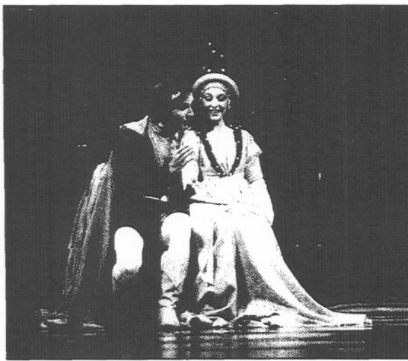
"El vergonzoso en palacio", de la CNTC, máxima recaudación en Barcelona.

Así pues, el año pasado quedó claramente demostrado que los únicos enemigos del teatro son el calor —que no el buen tiempo— y las malas programaciones que suelen acompañarlo. O en otras palabras: que si las condiciones son aceptables y los espectáculos atractivos (no me atrevo a decir buenos, porque ambos adjetivos