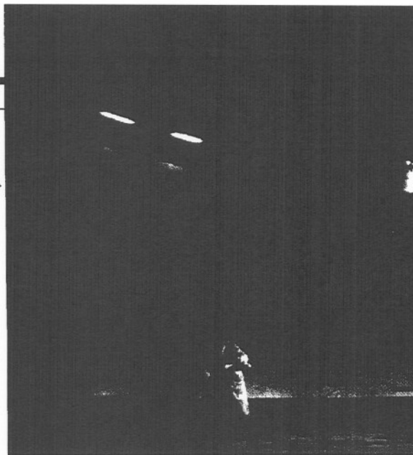
"Residuals" (arriba) y "Alfons IV", interesantes montajes víctimas de una sarcástica programación.

Digamos, para terminar, que junio, con sus más de cien millones de recaudación, sus casi 63.000 espectadores (los mismos que el año pasado, pero con una oferta muy inferior) y una ocupación global del 0,47, que refleja positivamente la desaparición de las 1.212 bucatas casi siempre vacías del Apolo, también se ha situado en una zona más propia de la alta temporada que de la