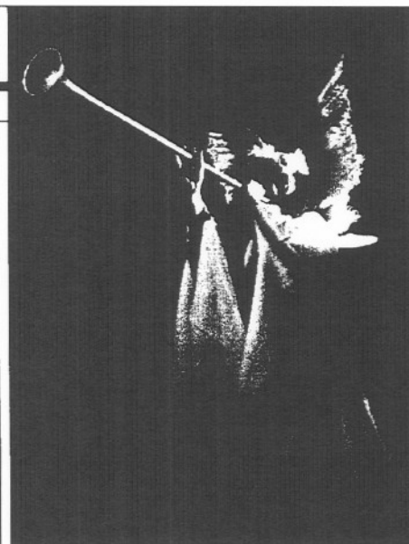
"El Gran Teatre Natural d'Oklahoma".

La Ley de Gas sería incontrovertible si tuviese el rigor de un silogismo. Lamentablemente, tiene la brillantez de un sofisma al modo de la paradoja de la tortuga y Aquiles. Se basa en un axioma falso porque el Festival de Tardor, en realidad, no ha