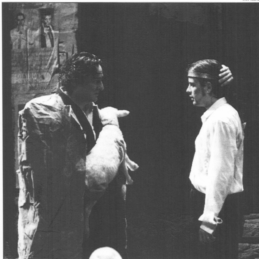
"Edipo rey", de Sófocles, pasado por el tamiz de Heiner Müller y Matthias Langhoff.

D ice el refrán que quien pasa el mes de enero pasa el año entero. Si así fuese, habría que soltar las campanas al vuelo porque este enero de 1992, como si respondiese a las expectativas del año mágico, nos ha deparado un fulgurante despegue: 73.197 espectadores, que son pocos comparados con el infinito, pero muchos más (el 35 por 100 más) que los 54.303 del año anterior. El coeficiente de ocupación global supera el 0,50 gracias a cuatro espectáculos: Petits contes misogins (Mercat de les Flors), Oscar and Sherlock (Goya), Memory (Tívoli, con un total de 30.008 butacas vendidas) y la reposición de Makinavaja en la Villarroel. Más optimistas podríamos ser aún si atendiésemos al taquillaje, que se eleva —con casi 117 millones— un 86 por 100 por encima de la cota de enero del 91.