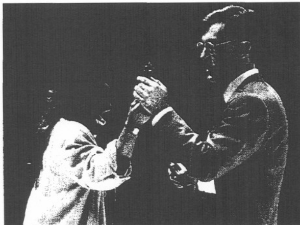
"El parc", de Botho Strauss, en el Teatre Lliure.

nuevo en los más bajos fondos de la historia del chivato barcelonés, con sólo 54.664 espectadores, una cifra similar a la de la fatídica temporada 87-88. Y ello por dos razones muy simples: algunos nuevos títulos no encuentran la audiencia que cabía esperar (es el caso de A la glorieta , en el Poliorama) y, sobre todo, el musical Memory celebra sus dos últimas representaciones a primeros de mes y luego, en olor de multitudes, desaparece del cartel. Así de frágil es nuestra industria teatral. Tan frágil que —estadísticamente— hoy depende de una sola actriz que consagra todo su savoir faire a la re-