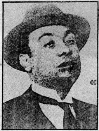
Cambó i Salvador Seguí, catalans excepcionals.