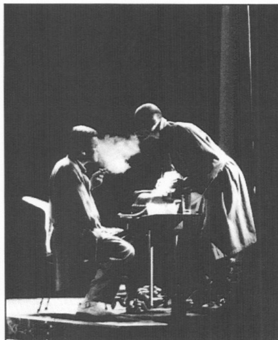
Dos escenas de "Eclipsi", de Joan Abellán, dirección de Jaume Melendres.

son, en sí mismas, arte. El problema, el único problema del director, es utilizarlas adecuadamente. Si hay alguna técnica específica del director de escena esa técnica es verbal.